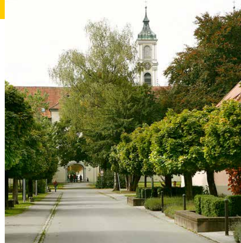
Stand: Mai 2016

Für Mittagessen und Pausenverpflegung wird ein Unkostenbeitrag in Höhe von 15 € erhoben.